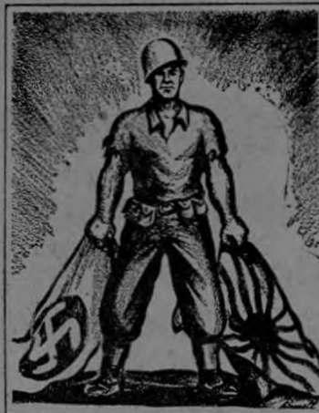
Bisell en el Nashville Tennessee. Misión cumplida.

“Creo que conozco al soldado y al marino estadounidense,” dijo el Presidente, quien prestó servicios como soldado en la primera guerra mundial. “A él no le gusta recibir gratitud ni simpatía. Tenía una