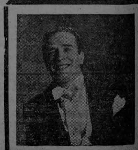
CENTELLAS director artístico y animador